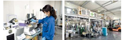
引火点試験用にサンプルをセットする様子。 総面積19316k㎡を誇る成田工場内。