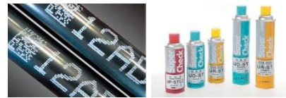
文字や二次元コードの印字ハイブ。 染色浸透探傷剤「スーパーチェック」。

人間が健康診断を受けるように、様々な部品や製品の微細な欠陥を壊すことなく見つけ出す「非破壊検査」と、ペトポトやタイヤ、LPGボンベといった製品に製造番号などの重要な情報、いわば品質保証スタンプを施す「印字・マーキング」。どちらも安全安心なモノづくりが基本の製造業にとって必要不可欠である。これらを主力事業としているのが1955年創業のマークテックだ。